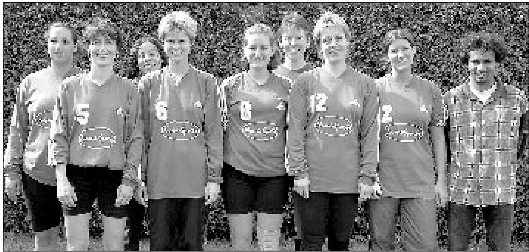
Les filles de Moutier n'ont glané qu'un point jusqu'ici en deuxième ligue. Elles n'en perdent pas le sourire pour autant.

Championnat régional • Les Ajoulotes s'inclinent face à Bienne. VFM en verve