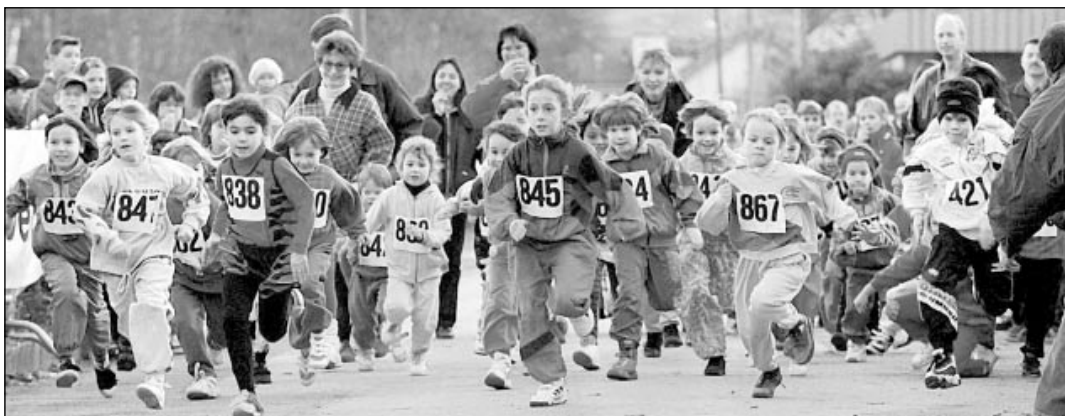
Depuis cette photo prise en 1997, les Foulées de l'ARCOM, à Bassecourt, n'ont pas pris une ride. Au contraire: la 18 e édition, le samedi 27 novembre prochain, sera résolument axée sur la jeunesse.

• Renseignements auprès de René Bouele, ☎ 032 422 69 86, ou d'Alain Steger, ☎ 032 422 60 84 ou sur le site internet www.cadelemont.ch.